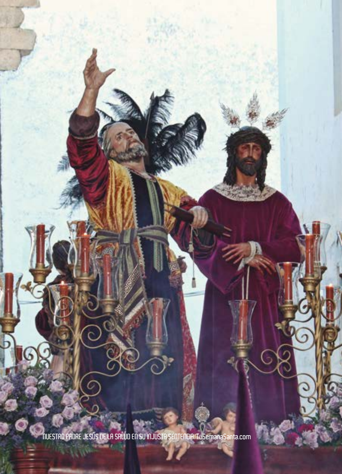
NUESTRO PADRE JESÚS DE LA SALUD EN SU INJUSTA SENTENCIA. TuSemanaSanta.com

MUSICAL ACCOMPANIMENT: Musical Group Virgen De La Vega (Salamanca) In The Passage Of The Lord And The Music Band Ntra. Mrs. De La Soledad De La Algaba (Sevilla) After The Virgin