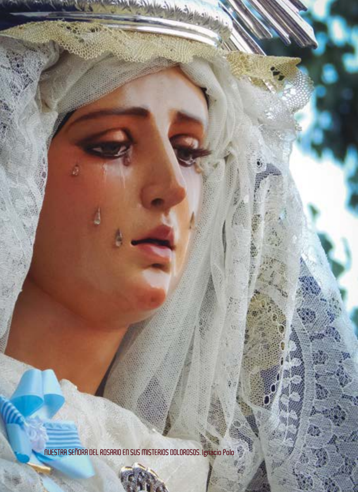
NUESTRA SEÑORA DEL ROSARIO EN SUS MISTERIOS DOLOROSOS. Ignacio Polo